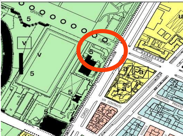
Estratto azzonamento P.R.G.C. tav.1 foglio 12B