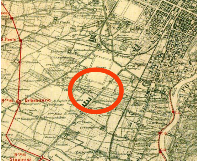
Torino e dintorni, mappa IGM del 1909 con tracciato della cinta daziaria definitiva, ASCT, Tipi e disegni, 20.1.30