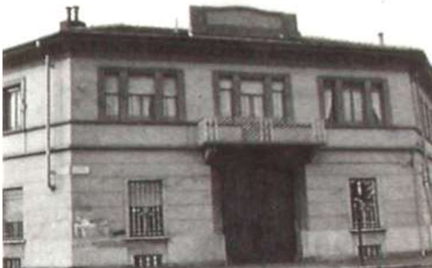
AEM centrale Sebastopoli nel 1984 circa