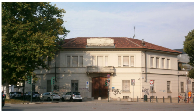
Prospetto principale dell'edificio