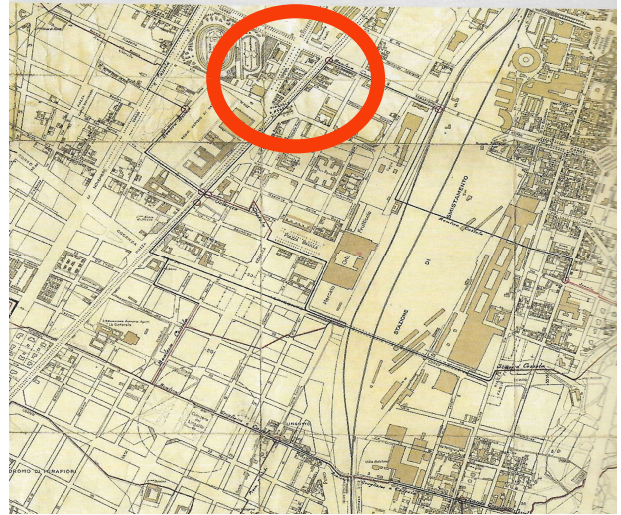
Servizio Tecnico Municipale dei Lavori Pubblici, pianta di Torino con indicazione dei due Piani Regolatori e di Ampliamento rispettivamente delle zone piana e collinare, aggiornati con le varianti deliberate sino a Giugno 1935, ASCT, Tipi e disegni, 64.7.8.1-8.