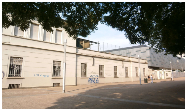
Prospetto prospiciente Piazzale Grande Torino