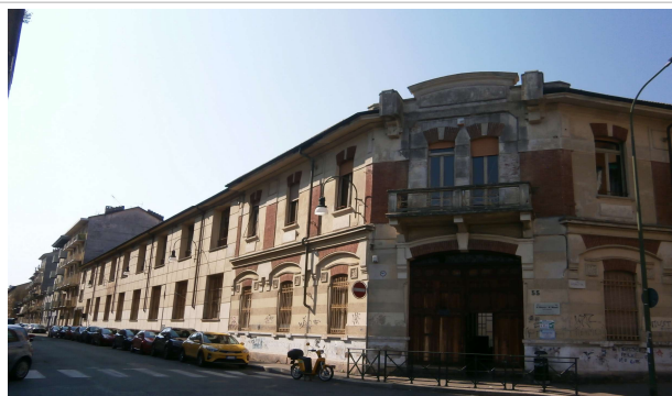
Scorcio verso via Revello