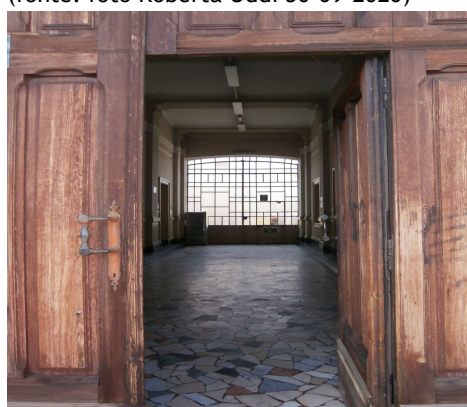
Ingresso e androne su via Moretta angolo via Revello