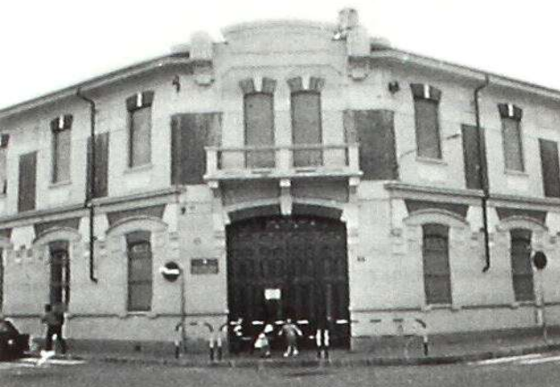
Immagine d'epoca