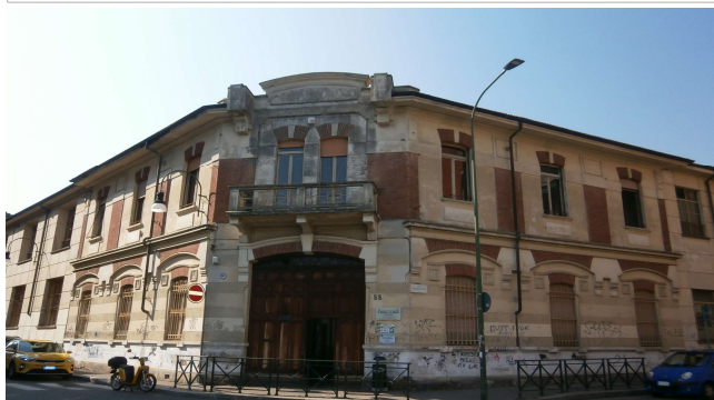
Prospetto su via Moretta angolo via Revello