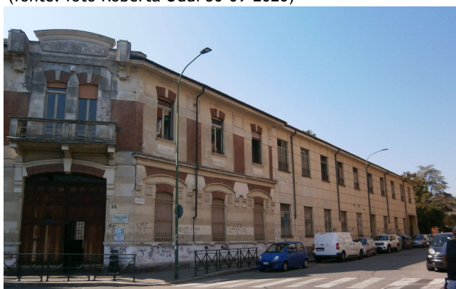
Scorcio verso via Moretta