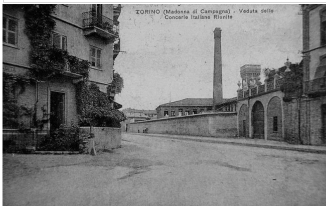
Cartolina anni Cinquanta - veduta delle CIR