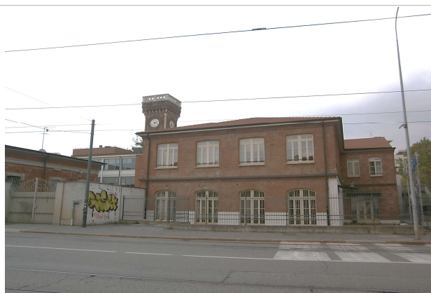
Corpo di fabbrica laterale a destra dell'ingresso (fonte: foto Roberta Oddi 13/04/2019)