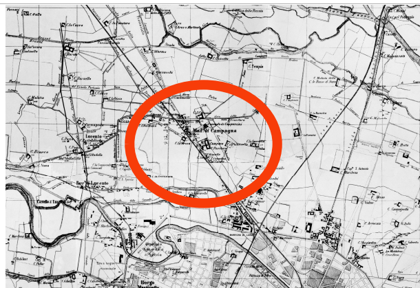
Ufficio Municipale dei Lavori Pubblici, Carta Topografica del Territorio di Torino divisa in sette fogli, 1879-98, ASCT, Tipi e disegni, 64.8