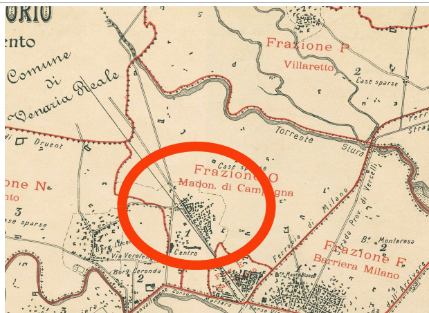
Comune di Torino, Piano Topografico del Territorio ripartito in Frazioni e Sezioni di Censimento, 1911, ASCT, Tipi e disegni, 64.8.17