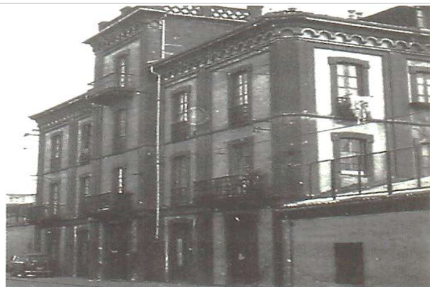
Immagine d'epoca ex filatoio Boyer