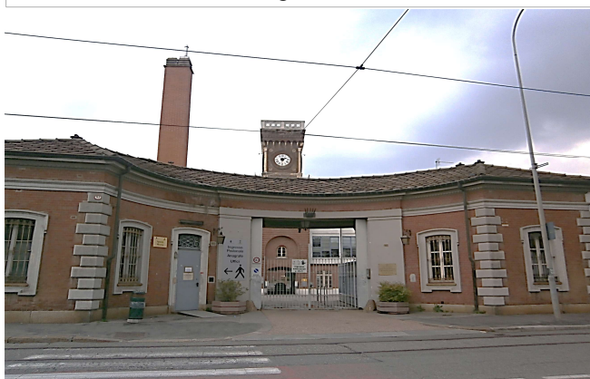
Ingresso principale su Via Stradella