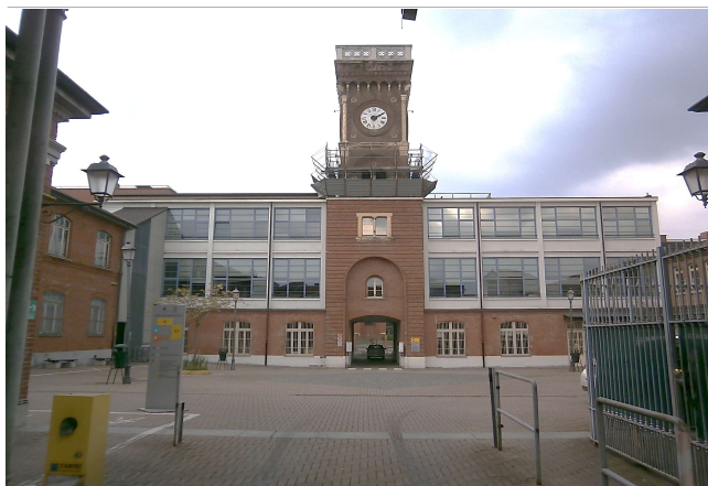
Corpo di fabbrica centrale in corte interna