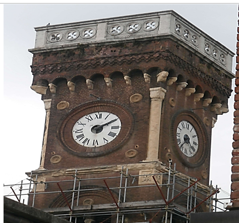
Dettaglio torre orologio su corpo di fabbrica centrale