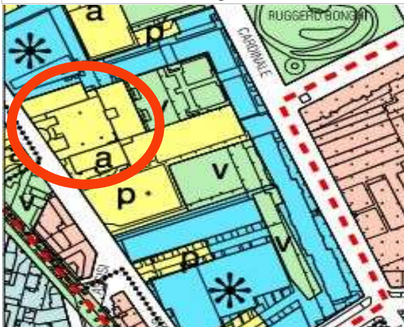
Estratto azzonamento P.R.G.C. tav.1 foglio 5A