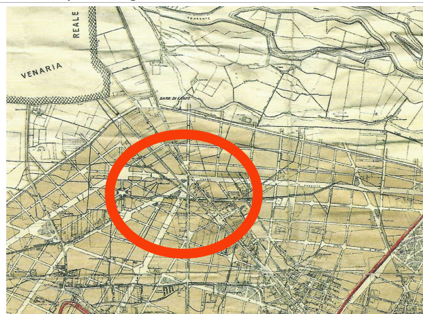
Ufficio Municipale dei Lavori Pubblici, Pianta di Torino con l'indicazione dei due Piani Regolatori e di Ampliamento rispettivamente delle zone piana e collinare adottati da Consiglio Comunale nel 1913, colle varianti approvate successivamente sino a Maggio 1915, 1916, ASCT, Tipi e disegni, 64.6.8