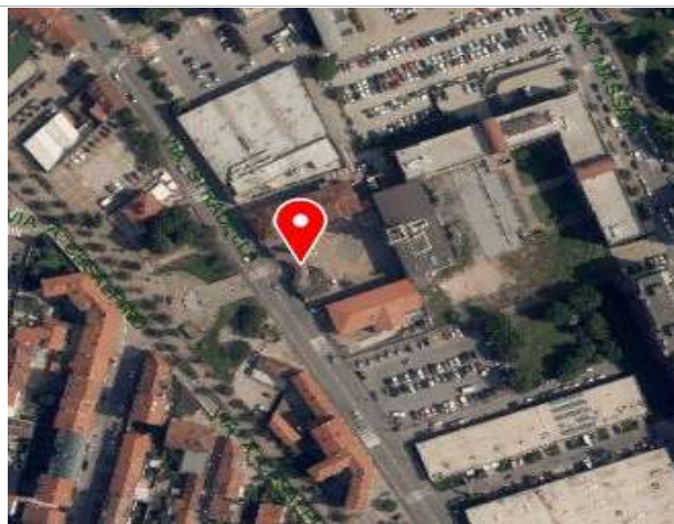
Ortofoto della Città di Torino, 2018