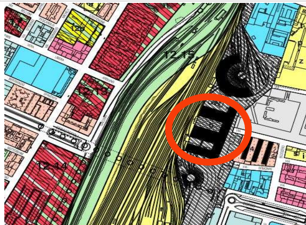
Estratto azzonamento P.R.G.C. tav.1 foglio 12B