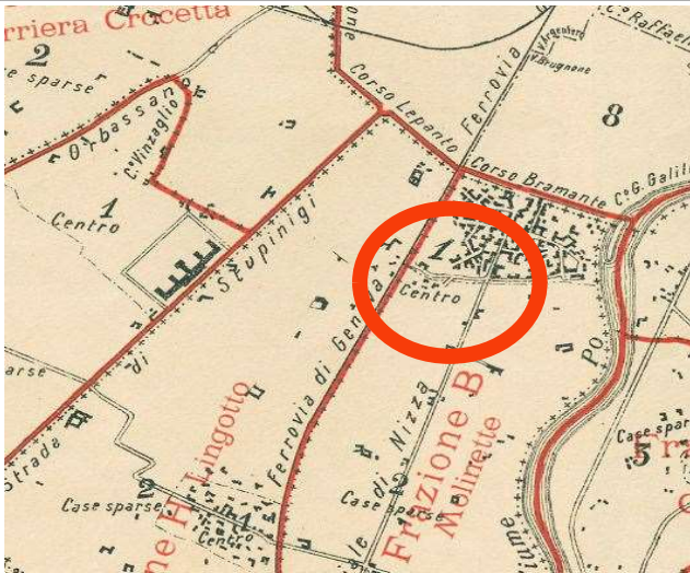
Comune di Torino, primo censimento degli opifici e imprese industriali, Piano Topografico del Territorio ripartito in Frazioni e Sezioni di Censimento, 10 giugno 1911, ASCT, Tipi e disegni, 64.8.17[1].