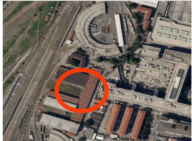
Ortofoto della Città di Torino, 2018