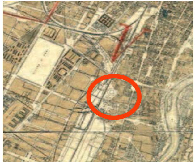
Ufficio Municipale dei Lavori Pubblici, Pianta di Torino con l'indicazione dei due Piani Regolatori e di Ampliamento delle zone piana e collinare adottati dal Consiglio Comunale nel 1913, con le varianti approvate sino a Maggio 1915, 1916, ASCT, Tipi e disegni, 64.6.8.