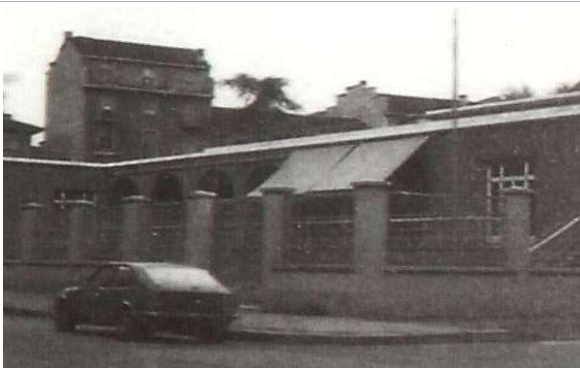
Immagine d'epoca