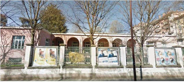
Prospetto su via Verolengo (fonte: foto Roberta Oddi 13/04/2019)