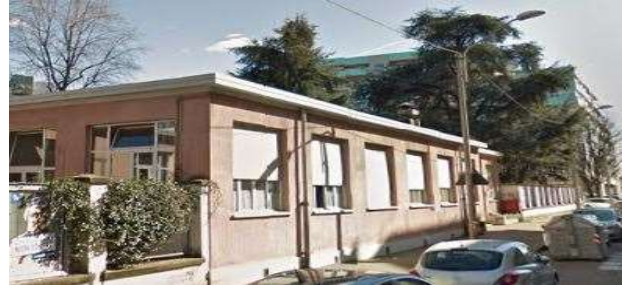
Prospetto su via S. Francesco d'Assisi (fonte: foto Roberta Oddi 13/04/2019)