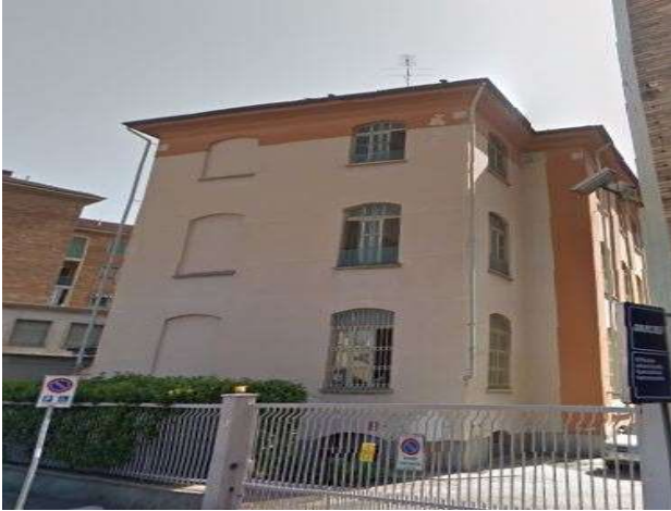
Prospetto su via del Ridotto