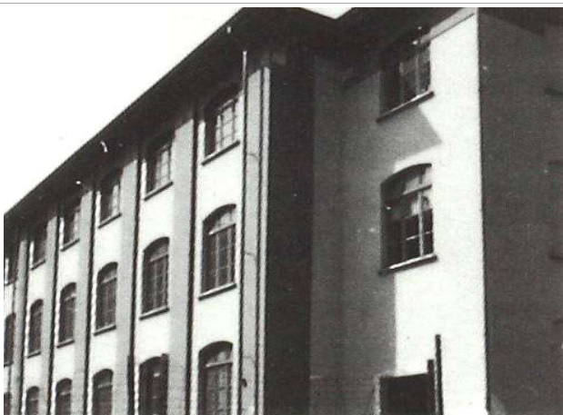
Immagine d'epoca