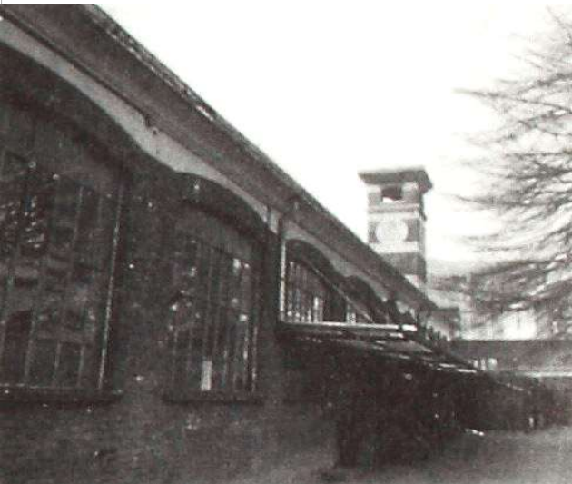
Immagine d'epoca