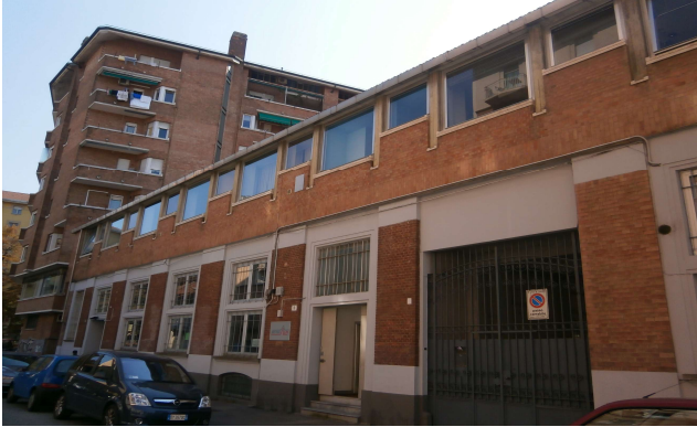
Veduta da via Bardonecchia