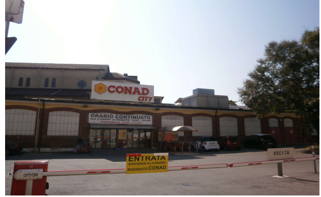
Veduta del fabbricato arretrato su via Bardonecchia