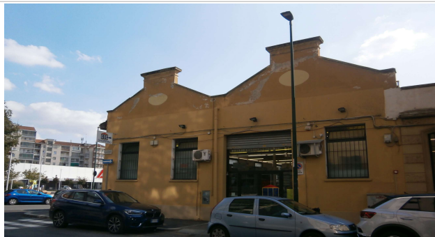
Veduta del complesso su via Sant'Antonino