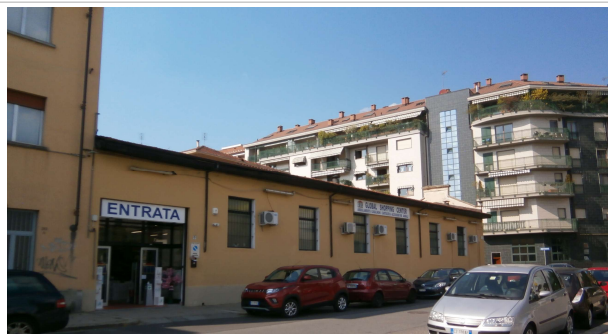
Prospetto su via Sant'Ambrogio