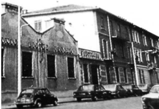
Immagine dei primi anni Ottanta del Novecento