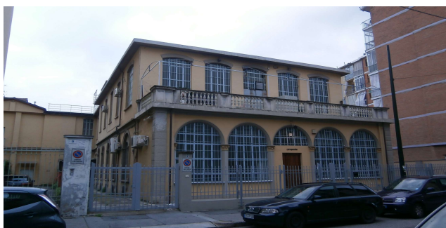
Veduta su via Beaulard