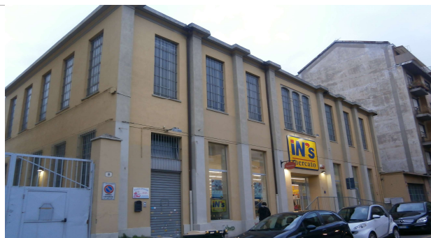
Veduta su via Rubiana (fonte: foto Roberta Oddi 13/04/2019)