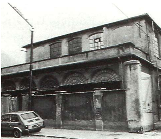
Immagine dei primi anni Ottanta del Novecento