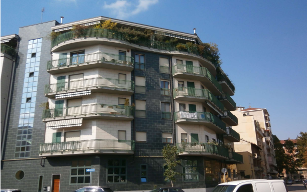
Veduta da via Sant'Ambrogio