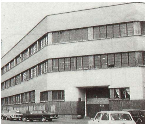
Immagine dei primi anni Ottanta del Novecento (fonte: www.immaginidelcambiamento.it )