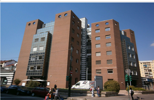
Veduta da corso Trapani