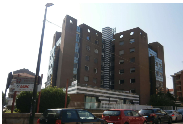
Veduta da via Freydour