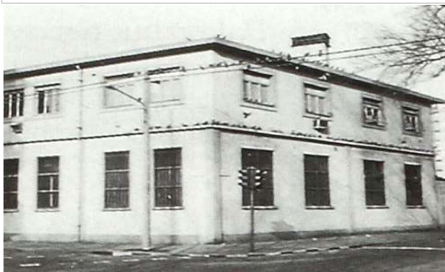
Immagine dei primi anni Ottanta del Novecento