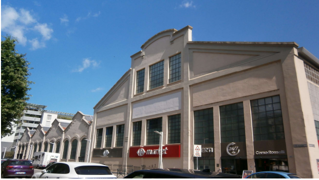
Prospetto principale su corso Rosselli