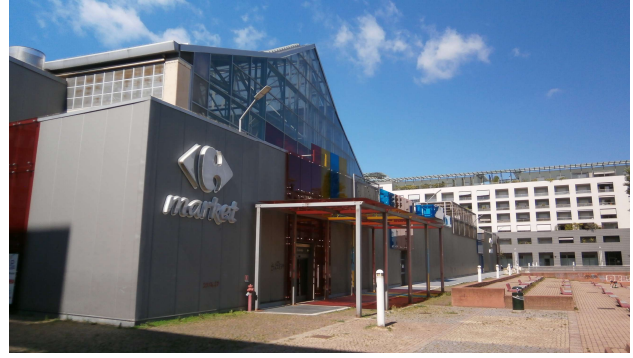
Prospetto sul retro prospiciente parco urbano attrezzato