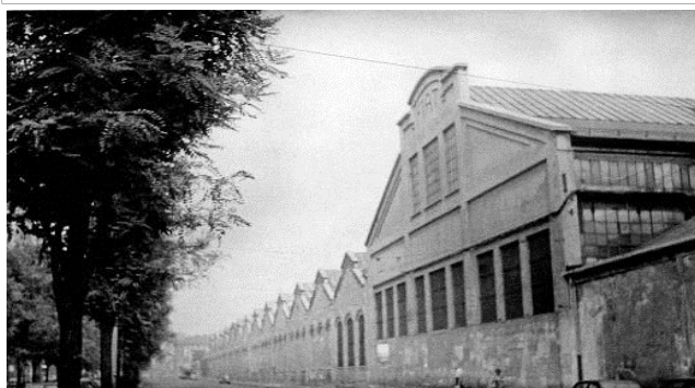
Immagine anni Settanta del Novecento