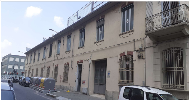
Prospetto su via Cervino