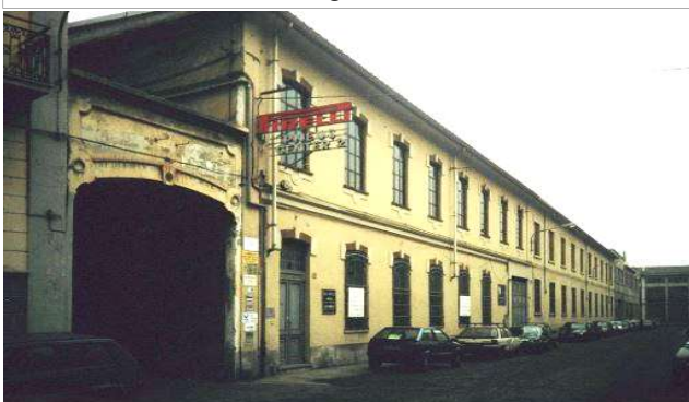
Immagine del 1997