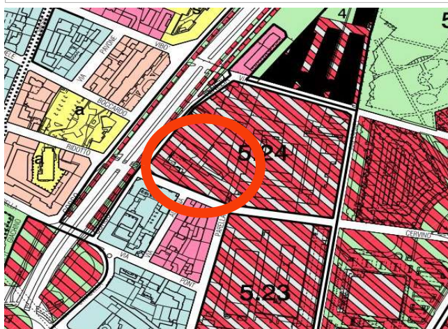
Estratto azzonamento P.R.G.C. tav.1 foglio 5A