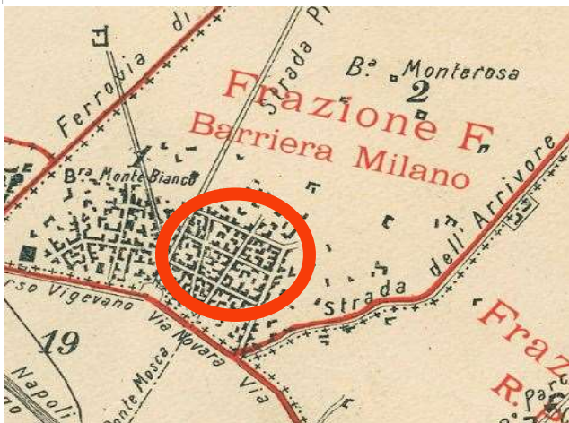
Comune di Torino, primo censimento degli opifici e imprese industriali, Piano Topografico del Territorio ripartito in Frazioni e Sezioni di Censimento, 10 giugno 1911, ASCT, Tipi e disegni, 64.8.17.