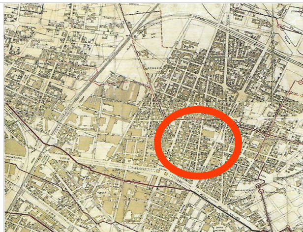
Servizio Tecnico Municipale dei Lavori Pubblici, pianta di Torino con indicazione dei due Piani Regolatori e di Ampliamento rispettivamente delle zone piana e collinare, aggiornati con le varianti deliberate sino a Giugno 1935