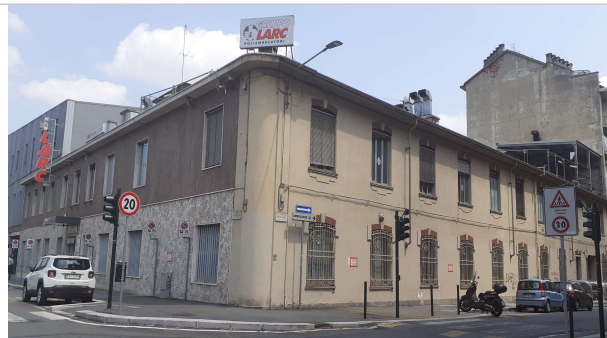
Prospetto su via Cervino angolo corso Venezia