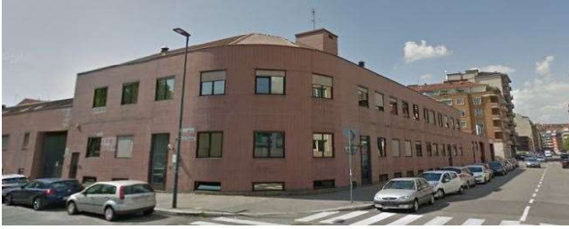
Veduta da via Spalato angolo via Millio (fonte: foto Roberta Oddi 13/04/2019)