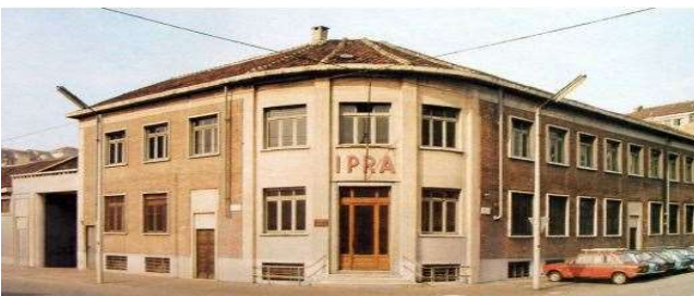
Immagine del 1970