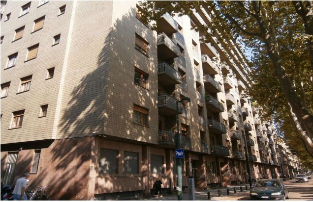
Veduta da corso Francia