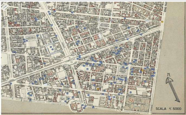
Bombe e mezzi incendiari lanciati 1:5000, 1942-1945. Zona 4: Campidoglio - Martinetto - Borgo S. Donato - Foro Boario - Boringhieri - Tesoriera. ASCT, Tipi e disegni, cart. 68, fasc. 1 disegno 4, quadrante 2.