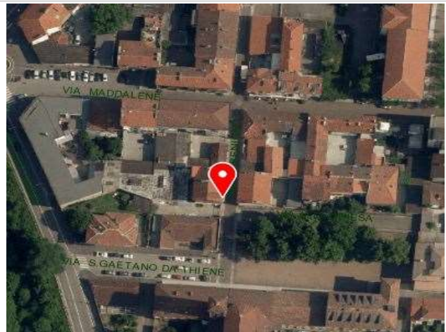
Ortofoto della Città di Torino, 2018