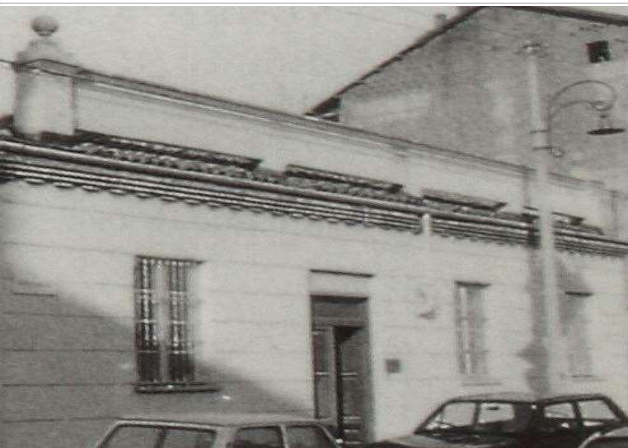
Immagine d'epoca