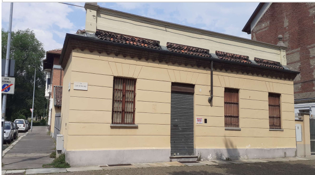
Prospetto su via San Benigno (fonte: foto Roberta Oddi 21/07/2020)