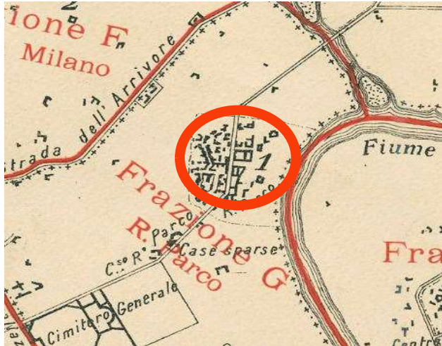
Comune di Torino, primo censimento degli opifici e imprese industriali, Piano Topografico del Territorio ripartito in Frazioni e Sezioni di Censimento, 10 giugno 1911, ASCT, Tipi e disegni, 64.8.17.