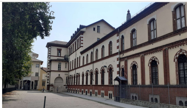
Veduta della piazza antistante all'edificio