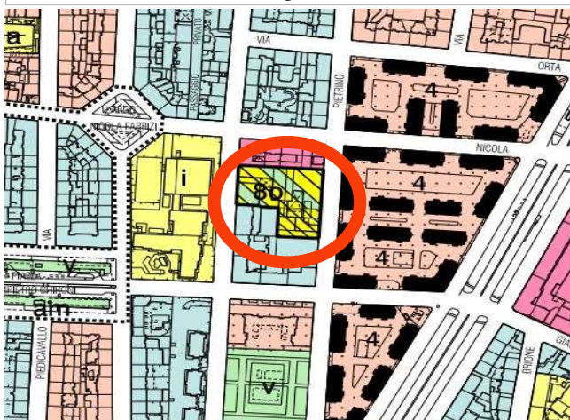
Estratto azzonamento P.R.G.C. tav.1 foglio 8B