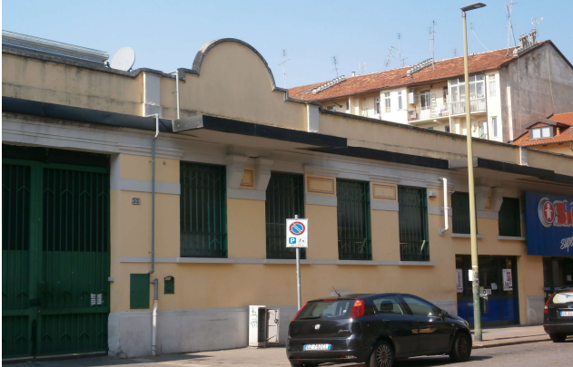
Veduta da via Pietrino Belli