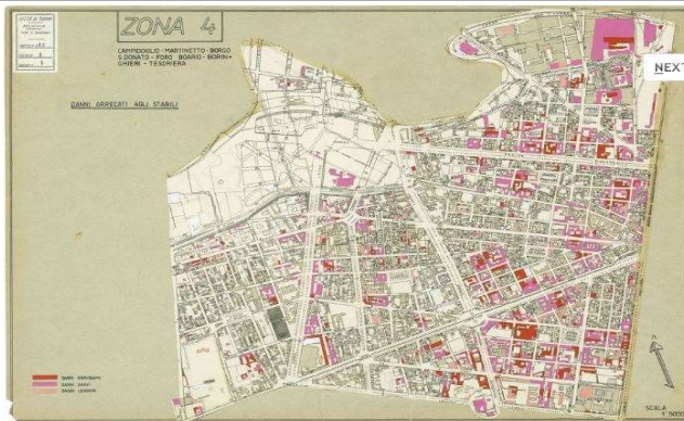
Danni arrecati agli stabili 1:5000, 1942-1945. Zona 4: Campidoglio, Martinetto, Borgo San Donato, Foro Boario, Borin, Ghieri, Tesoriera. ASCT, Tipi e disegni, cart. 68, fasc. 2 disegno 4.