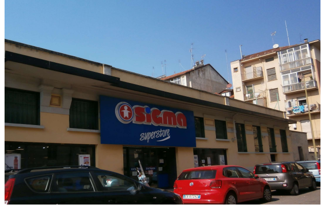
Veduta da via Pietrino Belli