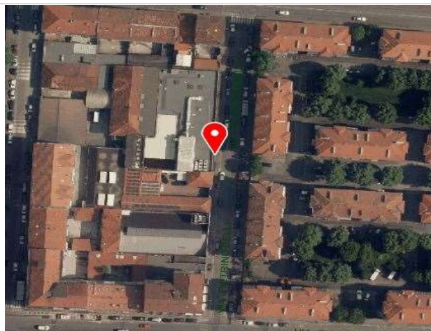
Ortofoto della Città di Torino, 2018