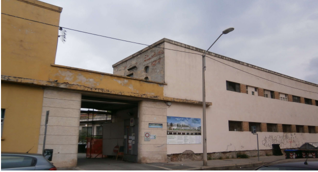
Ingresso su via Foligno