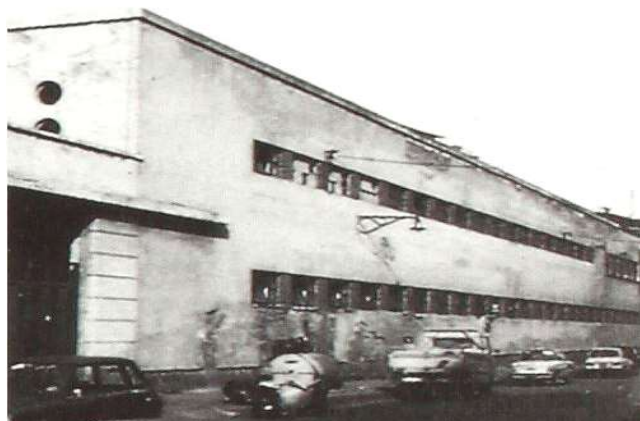
Immagine dei primi anni Ottanta del Novecento