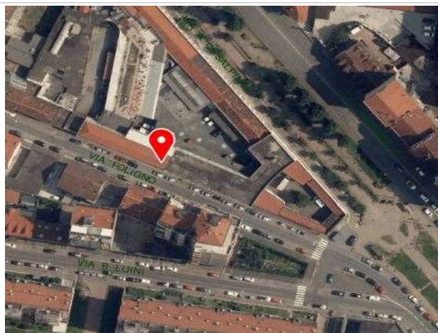
Ortofoto della Città di Torino, 2018