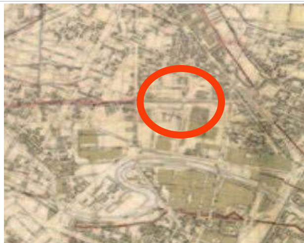
Servizio Tecnico Municipale dei Lavori Pubblici, pianta di Torino con indicazione dei due Piani Regolatori e di Ampliamento rispettivamente delle zone piana e collinare, aggiornati con le varianti deliberate sino a Giugno 1935