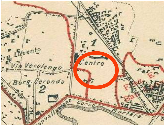
Comune di Torino, primo censimento degli opifici e imprese industriali, Piano Topografico del Territorio ripartito in Frazioni e Sezioni di Censimento, 10 giugno 1911, ASCT, Tipi e disegni, 64.8.17[1].