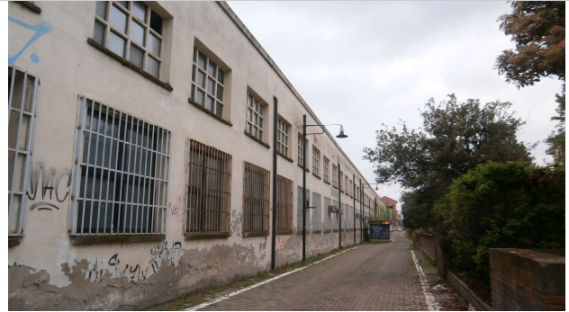
Prospetto lungo la ex ferrovia per le valli di Lanzo