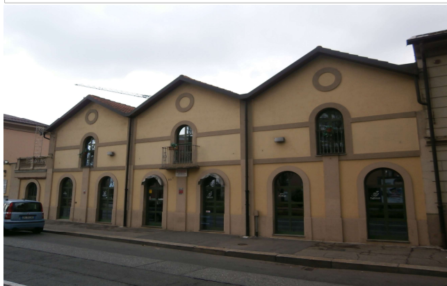
Prospetto su via Pianezza