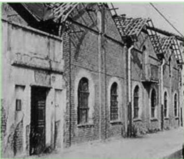
Fotografia degli anni Ottanta del Novecento