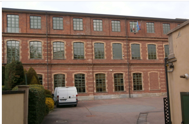
Fabbricato interno cortile