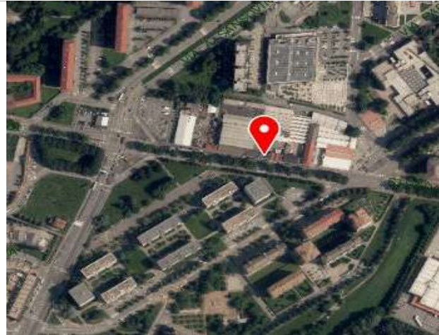
Ortofoto della Città di Torino, 2018