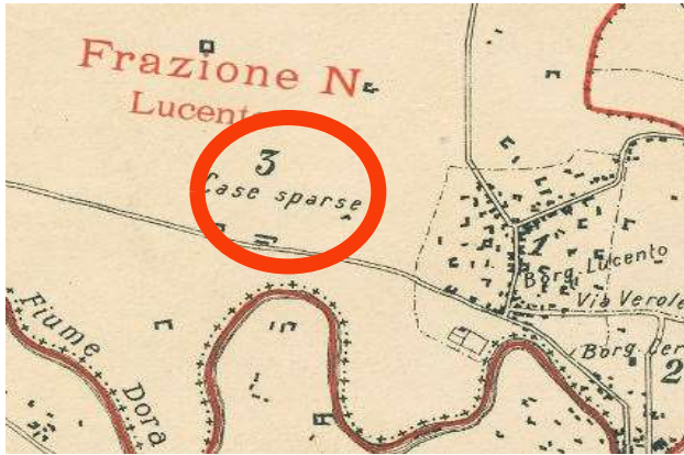
Comune di Torino, Piano Topografico del Territorio ripartito in Frazioni e Sezioni di Censimento, 1911, ASCT, Tipi e disegni, 64.8.17.