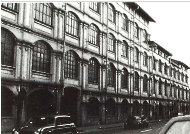
Immagine dei primi anni Ottanta del Novecento