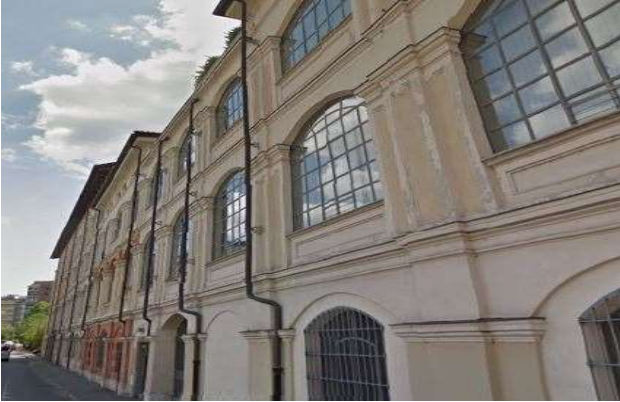
Veduta da via Pianezza