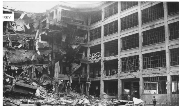
Bombardamenti nell'incursione aerea del 30 novembre 1942. UPA 2468D_9C03-29.