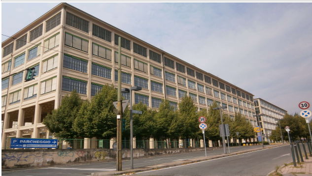
Prospetto su via Nizza (fonte: foto Roberta Oddi 28/07/2020)