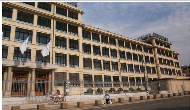
Prospetto su via Nizza