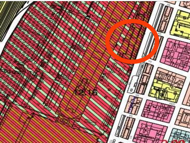
Estratto azzonamento P.R.G.C. tav.1 foglio 16B