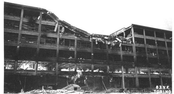
Bombardamenti nell'incursione aerea del 29 marzo 1944. UPA 4428_9E05-58.