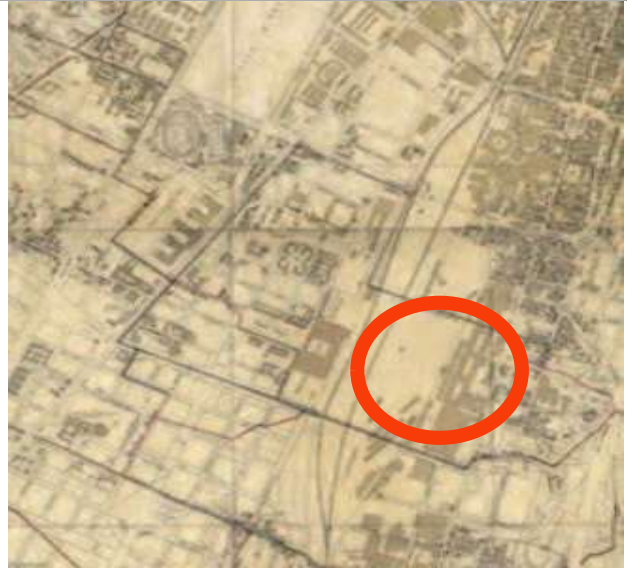
Servizio Tecnico Municipale dei Lavori Pubblici, pianta di Torino con indicazione dei due Piani Regolatori e di Ampliamento rispettivamente delle zone piana e collinare, aggiornati con le varianti deliberate sino a Giugno 1935, ASCT, Tipi e disegni, 64.7.8.1-8.