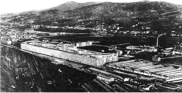
Immagine di fine anni Venti del Novecento, Archivio Storico Città Torino (FT 11A04_237) (fonte: www.immaginidelcambiamento.it )