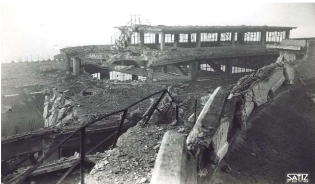
Bombardamenti nell'incursione aerea dell'8-9 dicembre 1942. UPA 2842D_9D02-02.