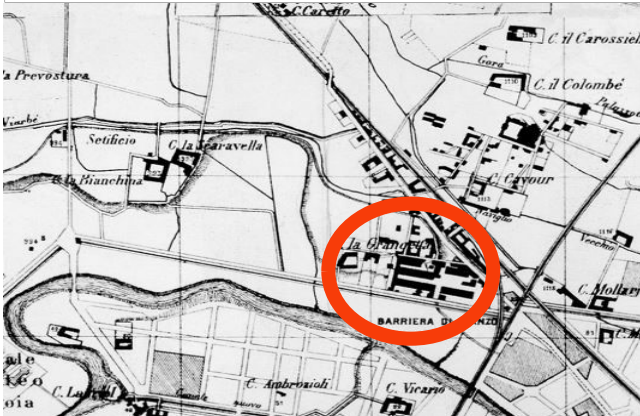
Ufficio Lavori Pubblici Municipale, Carta Topografica del Territorio di Torino, divisa in sette fogli, 1879-1898, ASCT, Tipi e disegni, 64.8.10-11