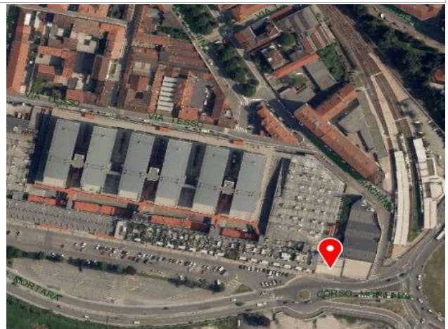
Ortofoto della Città di Torino, 2018