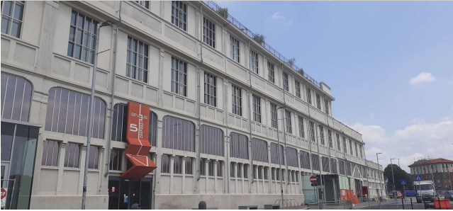
Prospetto su corso Mortara