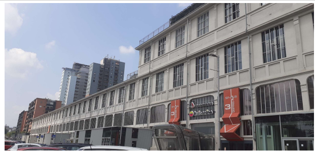
Prospetto su corso Mortara