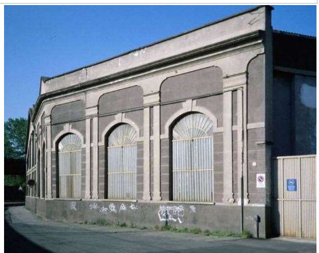
Immagine del 1997 verso via Giachino