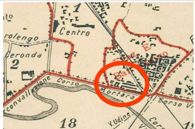
Comune di Torino, Piano Topografico del Territorio ripartito in Frazioni e Sezioni di Censimento, 1911, ASCT, Tipi e disegni, 64.8.17.