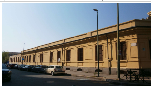
Veduta su via Cesana