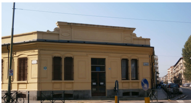
Veduta da via Frejus angolo via Cesana