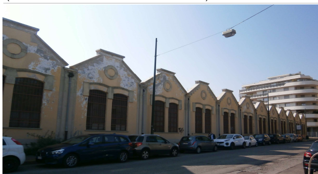
Veduta su via Frejus