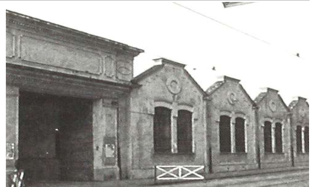
Immagine dei primi anni Ottanta del Novecento

Immagine dei primi anni Ottanta del Novecento