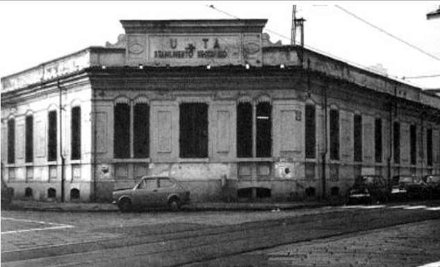
Immagine dei primi anni Ottanta del Novecento