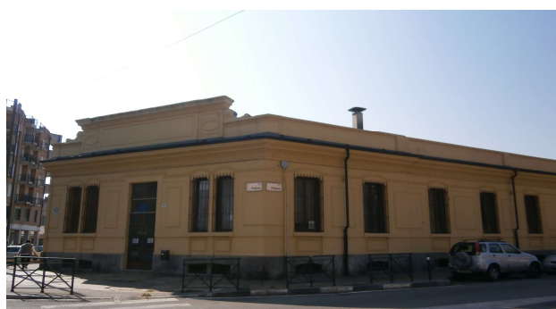
Veduta su via Frejus