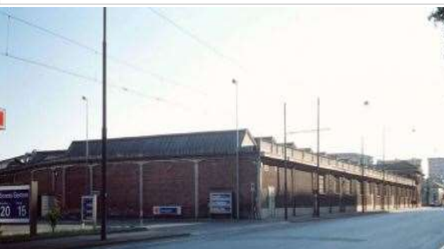
Immagine del 1997, foto Agata Spaziante (fonte: www.immaginidelcambiamento.it )