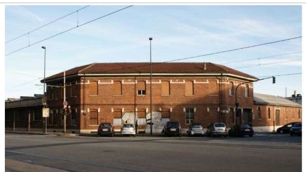
Immagine del 2009, foto Giuseppe Beraudo (fonte: www.museotorino.it )

Immagine del 1997, foto Agata Spaziante (fonte: www.immaginidelcambiamento.it )