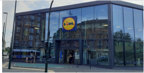
Supermercato Lidl sorto sul sito del complesso originario e ora adiacente a sede del Gruppo Bodino Engineering