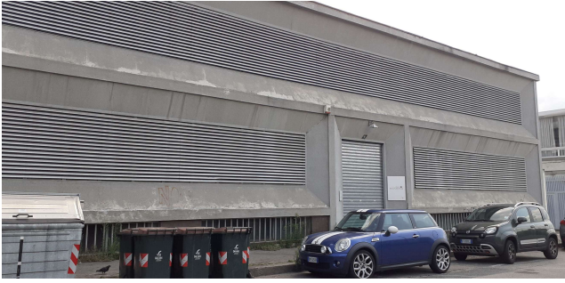
Sede attuale del Gruppo Bodino in via Pacini