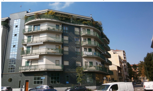
Edificio d'angolo su via Sant'Ambrogio