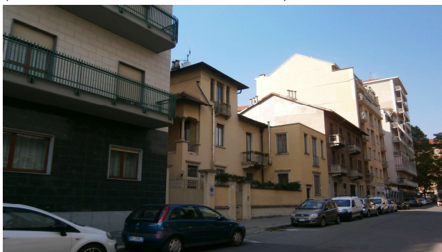
Scorcio su via Sant'Ambrogio