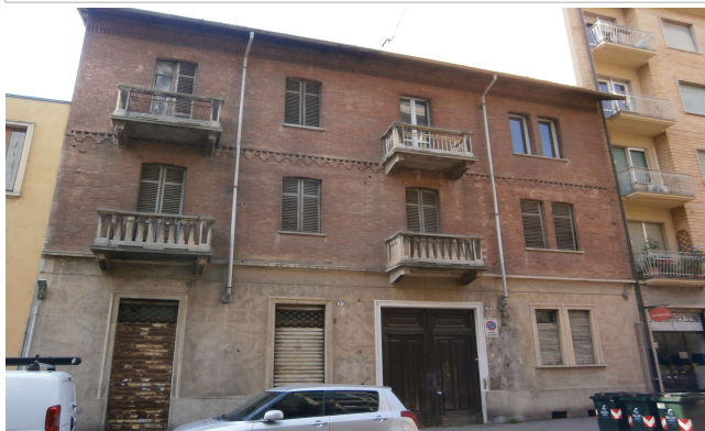
Veduta su via Sant'Ambrogio