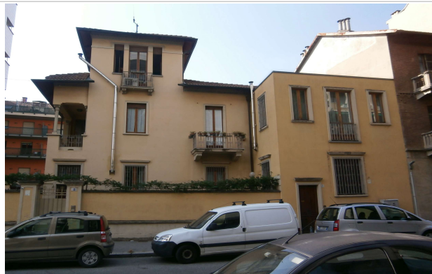
Veduta su via Sant'Ambrogio