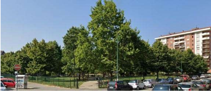
Veduta dei giardini pubblici «Bambini di Beslan»