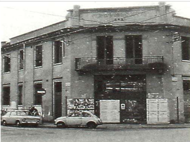
Immagine d'epoca