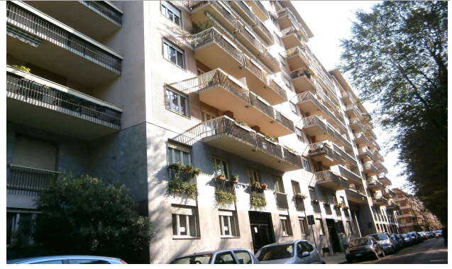
Veduta da corso Trapani