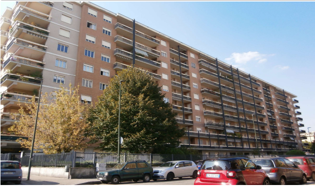
Veduta da via Serrano