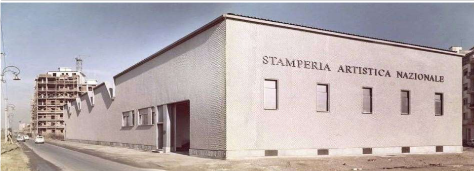
Immagine degli anni Sessanta del Novecento (fonte: www.museotorino.it )