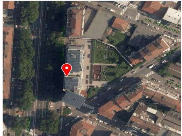
Ortofoto della Città di Torino, 2018