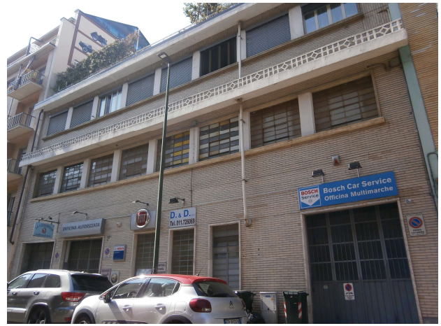
Veduta da via Zumaglia (fonte: foto Roberta Oddi 13/04/2019)