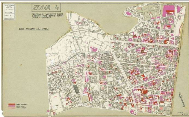
Danni arrecati agli stabili 1:5000, 1942-1945. Zona 4: Campidoglio, Martinetto, Borgo San Donato, Foro Boario, Borin, Ghieri, Tesoriera. ASCT, Tipi e disegni, cart. 68, fasc. 2 disegno 4.