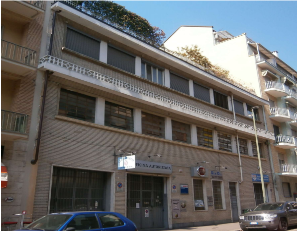
Veduta da via Zumaglia (fonte: foto Roberta Oddi 13/04/2019)