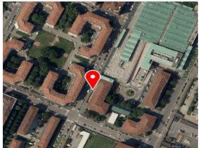
Ortofoto della Città di Torino, 2018