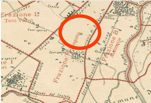
Comune di Torino, Piano Topografico del Territorio ripartito in Frazioni e Sezioni di Censimento, 1911, ASCT, Tipi e disegni, 64.8.17.