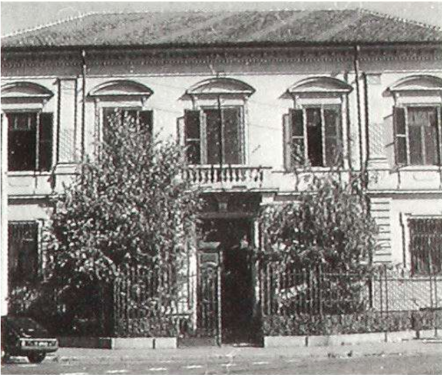
Immagine d'epoca