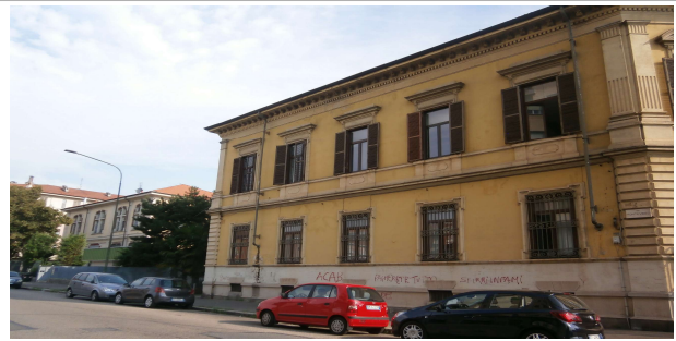
Prospetto su via Montevideo