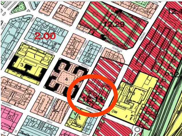
Estratto azzonamento P.R.G.C. tav.1 foglio 12B