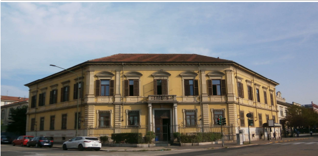
Prospetto principale su via Giannino Bruno